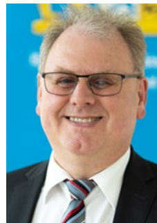
Albert Füracker, MdL Staatsminister